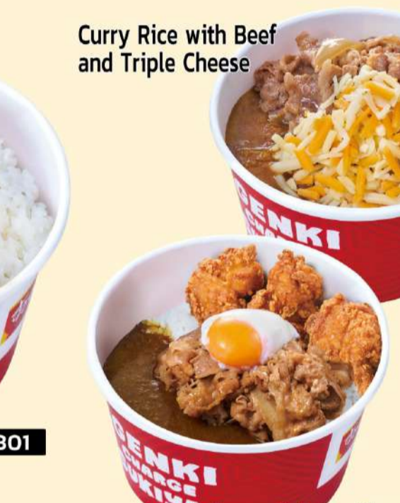
Curry Rice with Beef and Triple Cheese

Curry Rice with Karaage 301 からあげカレー M $9.9 S $9.3 L $11.8