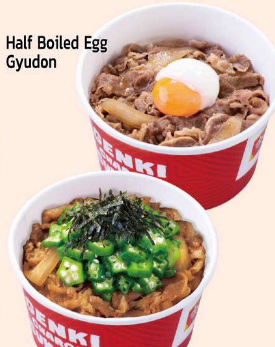
Half Boiled Egg Gyudon

Melted Cheese Gyudon 108 とろーり3種のチーズ牛丼 M $7.5 S $6.8 XM $9.5 L $9.5 XL $11.5