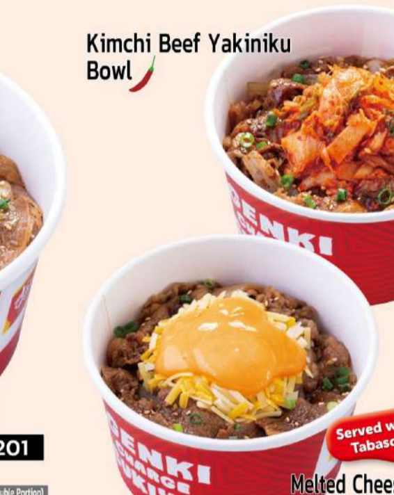
Kimchi Beef Yakiniku Bowl

Spring Onion and Half Boiled Egg Beef Yakiniku Bowl 201 ねぎ玉焼肉丼 M $8.8 Rice (L) $9.4 Extra Meat (Double Portion Rice L) $13.8